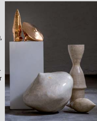
„Trias“ (Zweig), 2018, Bronze, 50 x 60 x 45 cm

*1949, Hemer Studium an der Kunstakademie Münster Meisterschüler Schwerpunkte: Zeichnung, Skulptur, Installation Mitglied im Kreiskunstverein Beckum- Warendorf, Westdeutscher Künstlerbund, VG Bild- Kunst www.ulrichmoeckel.de