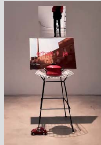
„Sie steht und bleibt – 1907-2021“ 2021 Installation 0,70 x 1,50 x 1,70 cm